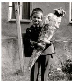
Der ganze Stolz zum Schulanfang: die riesige Schultüte