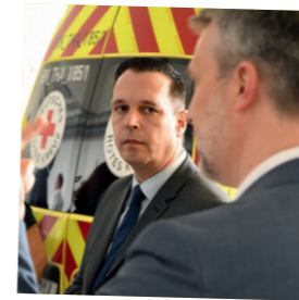
Auch unsere Rettungsdienste leisten einen wichtigen Beitrag - für uns alle!

Der Zugang zu medizinischen Leistungen darf keine Frage des Wohnortes sein. Wir brauchen gute Ärztinnen und Ärzte im ganzen Landkreis. Die Einführung einer Landarztquote beim Medizinstudium durch den Freistaat Sachsen war deshalb ein richtiger Schritt. Das kann aber nur ein Anfang sein. Klar ist für mich auch: Das Erzgebirgsklinikum bleibt in kommunaler Hand!