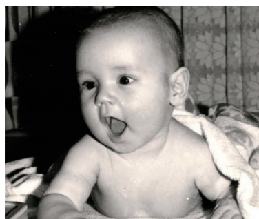
Erzgebirger von Geburt an - 1977 erblickte ich in Stollberg das Licht der Welt