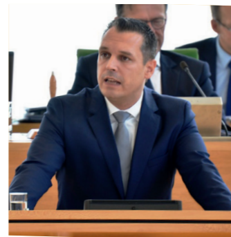
Einsatz für das Erzgebirge - seit 2014 als Abgeordneter im Sächsischen Landtag