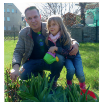
Heimat verbindet Generationen: meine Tochter besucht bald die gleiche Schule, auf der auch ich damals war