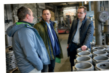
Im Gespräch mit den Betrieben um zu verstehen, wo der Schuh drückt

Vor dem Verteilen kommt das Erwirtschaften. Stärken wir den Mittelstand als Rückgrat unserer Wirtschaft und unterstützen wir Gründerinnen und Gründer, die hier etwas aufbauen wollen. Sorgen wir gemeinsam dafür, dass Fachkräfte die Chancen der Region erkennen und hierbleiben bzw. ins Erzgebirge zurückkehren.