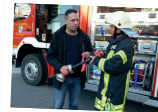
Die Unterstützung unserer Feuerwehr liegt mir sehr am Herzen

Ob freiwillige Feuerwehr, Katastrophenschutz, Sportvereine, Kirchenarbeit oder soziales und kulturelles Engagement – unsere Heimat lebt davon, dass Menschen anpacken. Unterstützen wir sie dabei! Vor Ort weiß man am besten, was benötigt wird. Deshalb setze ich mich für noch mehr Eigenverantwortung unserer Kommunen ein. Wir brauchen mehr Pauschalen und weniger Bürokratie.