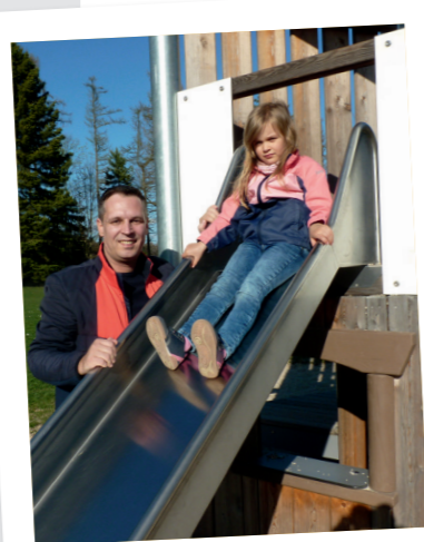
Ich wünsche mir eine gute Zukunft für meine Tochter

Die Familie ist das Fundament unserer Gesellschaft. Hier übernehmen die Generationen füreinander Verantwortung. Für mich heißt Familienpolitik nicht Bevormundung, sondern Freiräume schaffen, damit jeder seine eigenen Träume verwirklichen kann. Verbessern wir dazu die Vereinbarkeit von Familie und Beruf, sichern wir eine gute Kinderbetreuung und unterstützen wir die freien Träger in der Kinder- und Jugendarbeit.